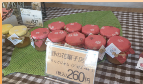
リンゴジャム(ジョナゴールド) 260円(税込)