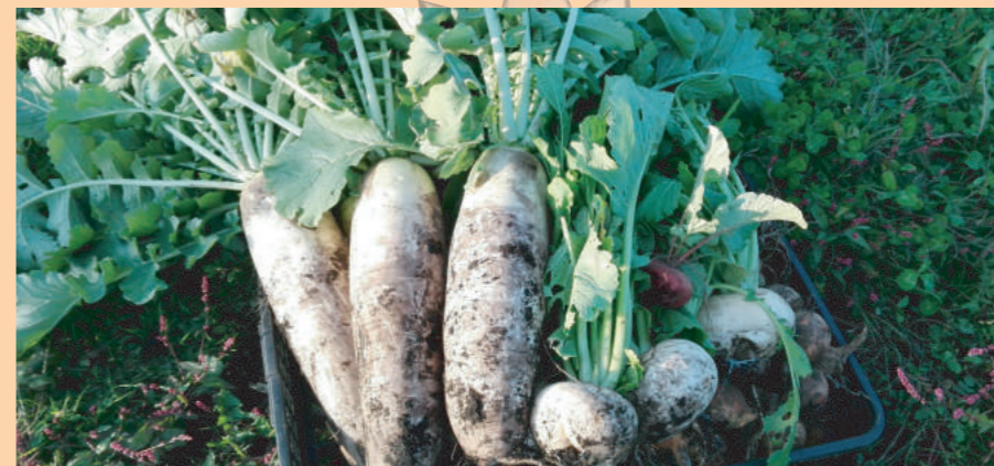
辛味が少なくとっても太い大根☆100円～150円 漬け物におすすめの白カブ☆80円となっております☆

★お問い合わせは…電話またはE-mailで / info@dpcmaika-hokkaido.com