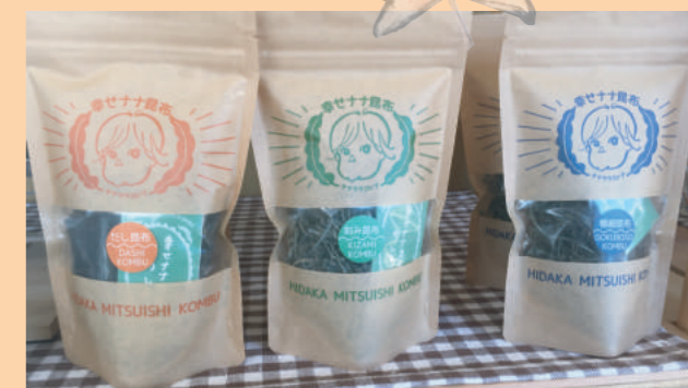
幸せナナ昆布 3種類 540円(税込)